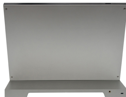
Rückansicht Polycom MSR Dock