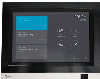
Vorderansicht Polycom MSR Dock